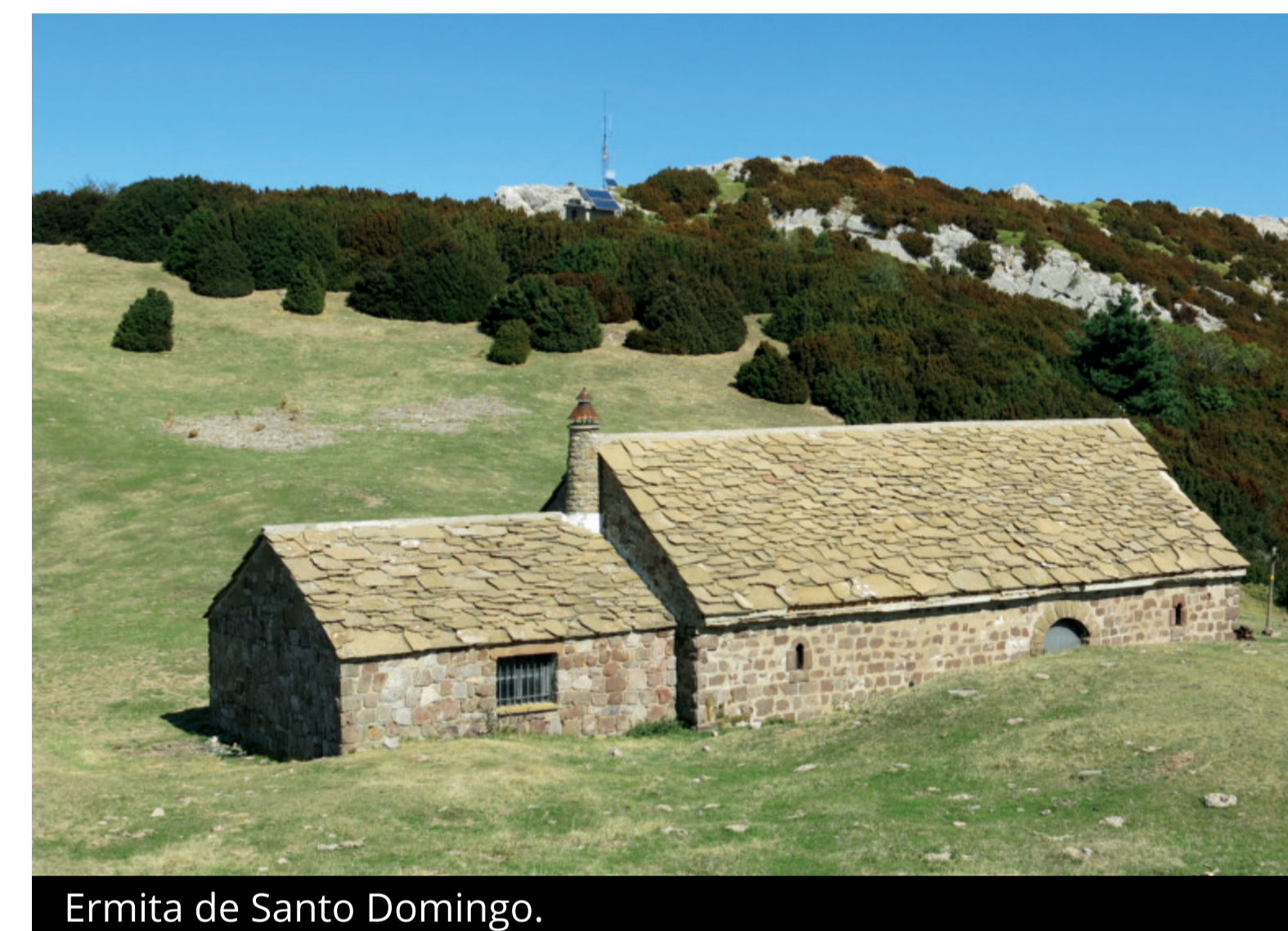
Ermita de Santo Domingo.