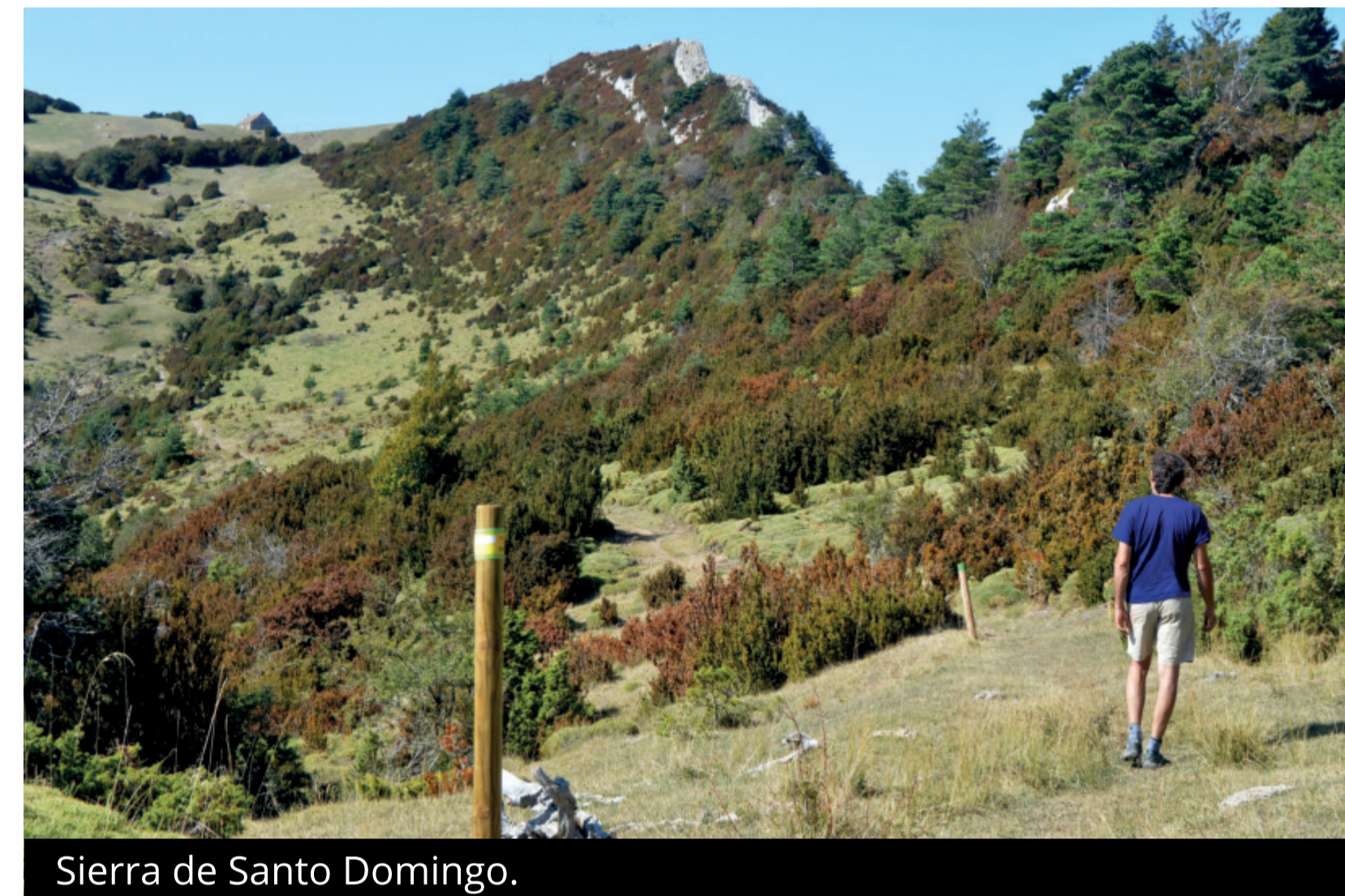
Sierra de Santo Domingo.

LA ERMITA DE SANTO DOMINGO, JUNTO A LA QUE TE ENCUENTRAS, RECIBE A LOS HABITANTES DE LONGÁS EL 25 DE JULIO QUE, DURANTE SUS FIESTAS MAYORES, SUBEN EN ROMERÍA PARA ASISTIR A MISA Y RECIBIR LA BENDICIÓN. SE RUEGA RESPETAR TANTO LA ERMITA COMO EL REFUGIO ADJUNTO. DESDE AQUÍ PUEDES ASCENDER AL CERCANO PICO SANTO DOMINGO (1.524 M), SITUADO JUSTO AL SUR DE LA ERMITA, O AL EXCEPCIONAL MIRADOR PANORÁMICO SITUADO EN UNA ABERTURA EN LA ROCA AL NORTE DE LA MISMA, DONDE UNA MESA DE INTERPRETACIÓN PERMITE IDENTIFICAR NUMEROSOS PUNTOS DE INTERÉS GEOGRÁFICO DEL VALLE DE LONGÁS, EL PREPIRINEO Y EL PIRINEO.