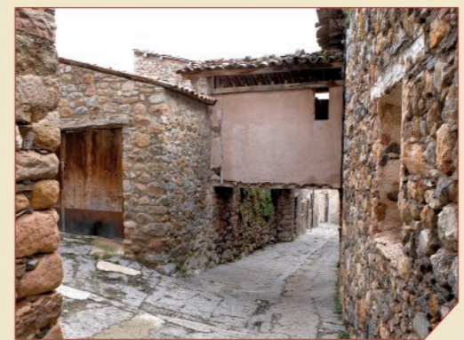
Arquitectura tradicional en Gabás.